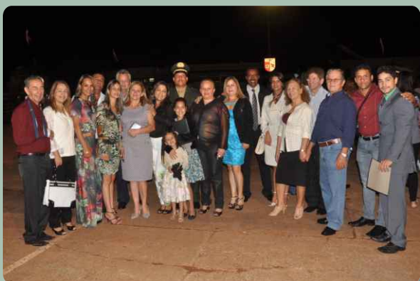
Familiares dos formandos