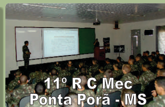
11º R C Mec Ponta Porã - MS