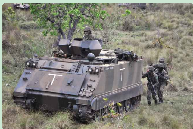
Viatura Blindada de Transporte de Pessoal M113

A operação teve por finalidade o adestramento da tropa, por meio da manabilidade dos Esquadrões de Carros de Combate e de Fuzileiros Blindados, além do tiro das Armas Coletivas.