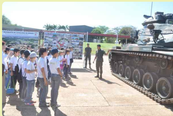
Exposição de blindados