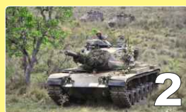
Campo de Betione