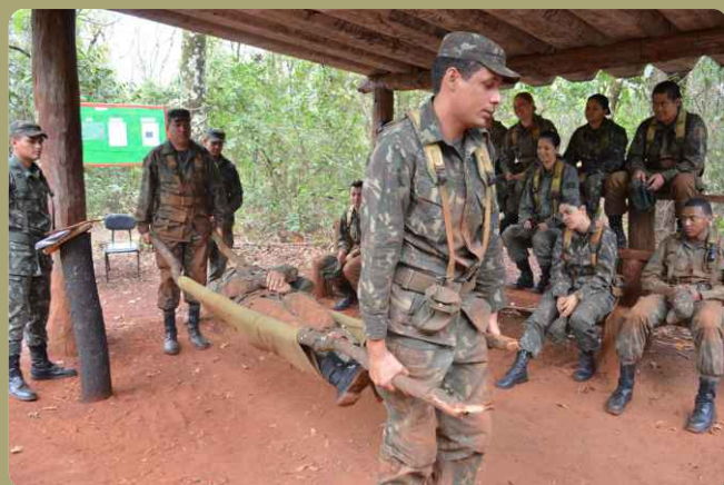
Instrução de transporte de ferido