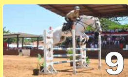
Copa Guaicurus de Hipismo