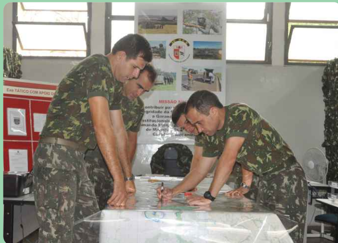
Comandante do 20º RCB e seu Estado-Maior

Participaram do evento militares do Comando Militar do Oeste, 5ª Divisão de Exército, 4ª Bda C Mec, 5ª Bda Cav Bld, 13ª Bda Inf Mtz e 18ª Bda Inf Fron.