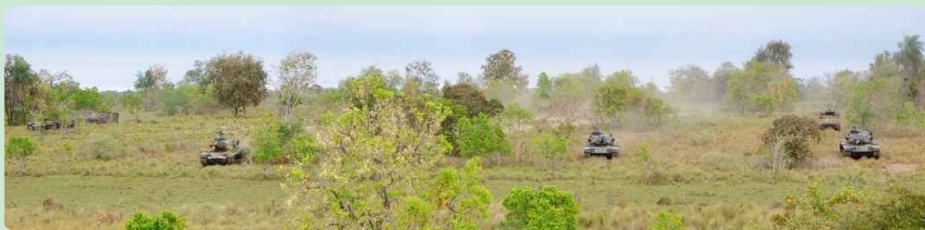
Viaturas blindadas do 20º RCB participam de exercício de adestramento