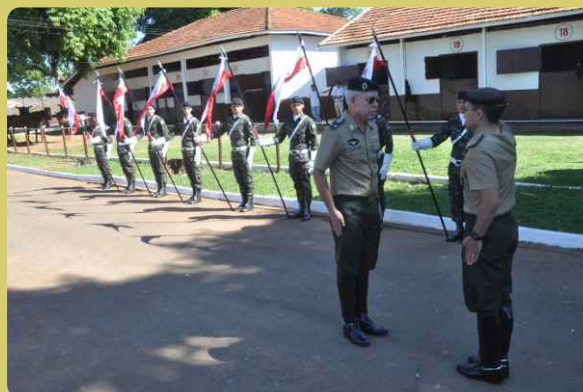
Recepção do Comandante da 4ª Bda C Mec