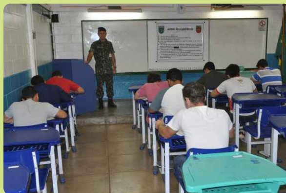
Aplicação da prova