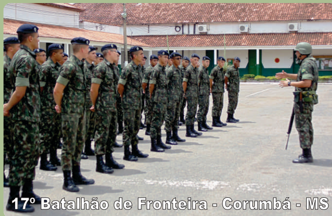
17º Batalhão de Fronteira - Corumbá - MS