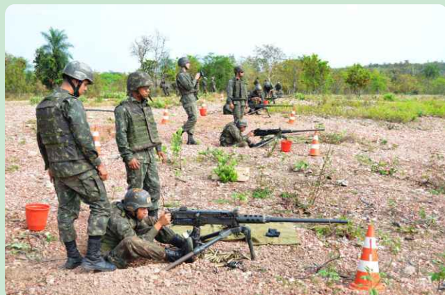
Tiro de metralhadora .50