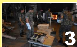
Queima de Entorpecentes