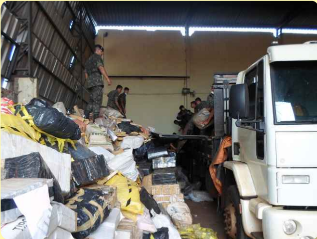
Descarga dos entorpecentes