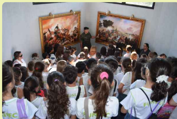
Visita às instalações