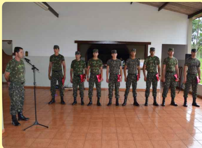
Despedida dos alunos por ocasião do encerramento do estágio

O objetivo do estágio foi proporcionar aos alunos, que estão na fase final da formação militar, a oportunidade de realizar atividades inerentes às funções do 3º Sargento, graduação à qual serão promovidos no final do mês de novembro.