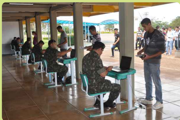
Triagem dos candidatos