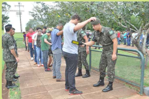
Recepção dos candidatos