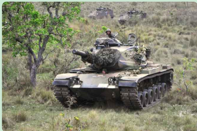
Viatura Blindada de Combate M60 A3 TTS

No período de 03 a 05 de outubro, o Regimento esteve no município de Miranda-MS, onde realizou um Exercício de Longa Duração no Campo de Instrução de Betione.