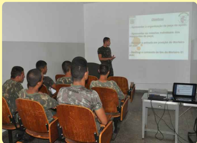
Aluno do CFS ministra instrução a soldados do 20º RCB

Alunos do Curso de Formação de Sargentos da Escola de Sargentos das Armas (EsSA) estiveram no 20º RCB no período de 14 a 25 de outubro, participando do Estágio de Preparação de Corpo de Tropa.