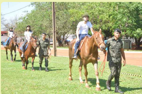
Passeio a cavalo