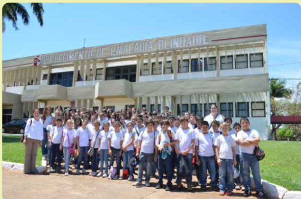
Recepção dos alunos

A Escola Professora Maria Lago Barcellos visitou o Regimento no dia 09 de outubro.