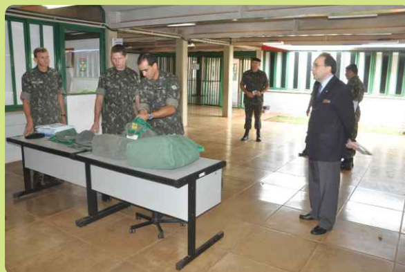
Abertura dos malotes contendo as provas