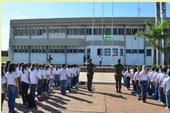
Hasteamento do Pavilhão Nacional

Na ocasião, foram realizadas diversas atividades que proporcionaram aos alunos a oportunidade de conhecerem as ações desenvolvidas pelo Exército Brasileiro ao longo de sua história, na manutenção da soberania nacional e na Garantia da Lei e da Ordem.