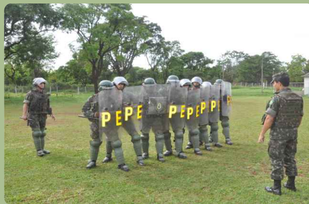
Força Pantanal (FORPAN) do 20º RCB participa de instruções de adestramento