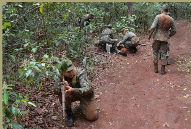
Instrução de primeiros socorros