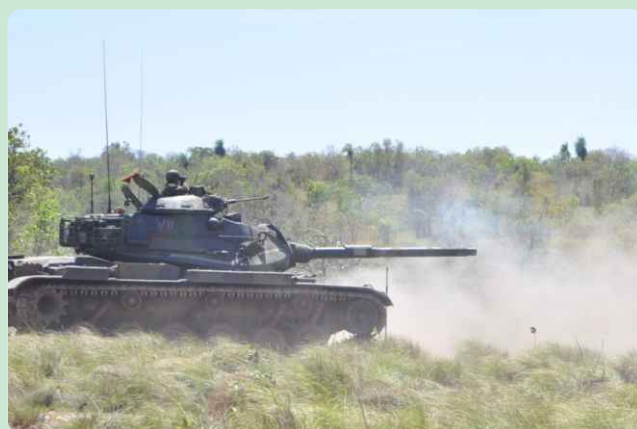
Tiro da VBC CC M60 A3 TTS