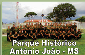
Parque Histórico Antônio João - MS