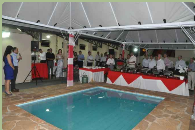
Ten Cel Vinícius apresenta as boas-vindas aos convidados

Também prestigiaram o evento os Comandantes das Organizações Militares subordinadas à 4ª Bda C Mec e oficiais do Comando do CMO, 9ª RM, 9º Gpt Log e autoridades ligadas ao hipismo.