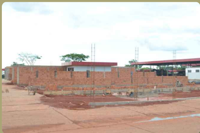
Construção do posto de lavagem