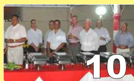
Jantar de Confraternização