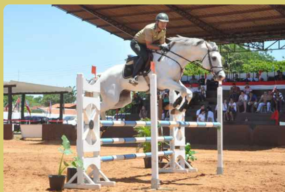
Flagrante da prova