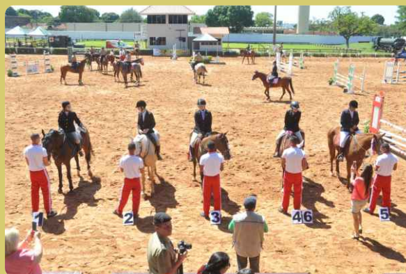
Cerimônia de premiação