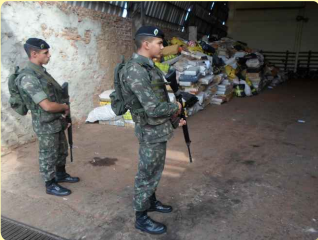
Segurança das instalações

Atendendo solicitação recebida, o 20º RCB apoiou, no período de 02 a 04 de outubro, a Delegacia Especializada de Repressão ao Narcotráfico (DENAR) da Polícia Civil na queima de entorpecentes que foram apreendidos pelos Órgãos de Segurança Pública do Mato Grosso do Sul.