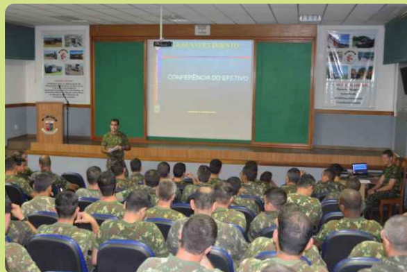
Instruções aos aplicadores e fiscais de prova

Posteriormente, foi feita a recepção e a triagem dos candidatos, que foram encaminhados para as salas previamente preparadas para a realização das provas do concurso de admissão.