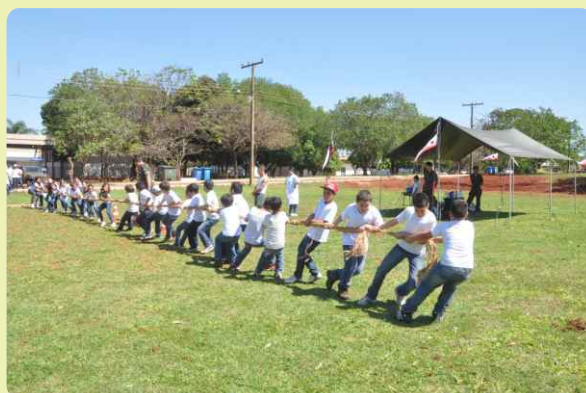
Cabo de guerra