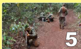
Instrução no Campo