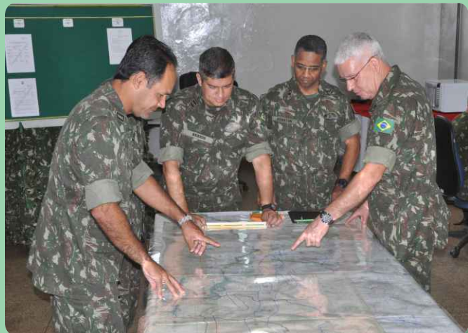
Comandante da 4ª Bda C Mec e seu Estado-Maior

De 15 a 18 de outubro, o 20º RCB foi uma das sedes utilizadas pelo CMO na realização do Exercício Tático com Apoio do Sistema de Simulação (ETASS) do corrente ano de instrução.