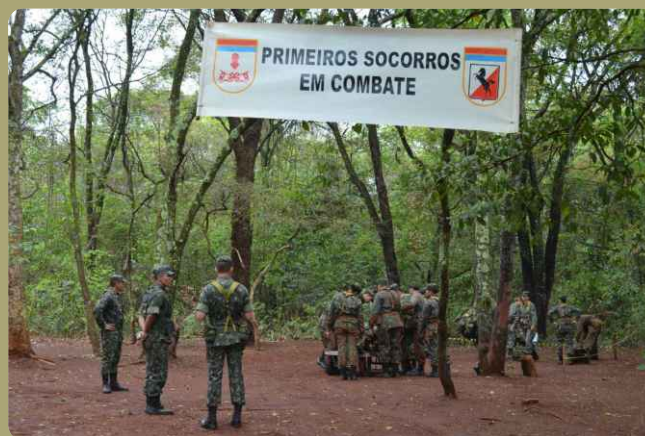
Área de acampamento do 20º RCB

Durante a jornada no campo, os estagiários receberam instruções de Primeiros Socorros em Combate.