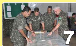
Simulação de Combate