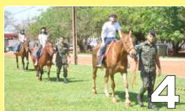
Visita ao Regimento