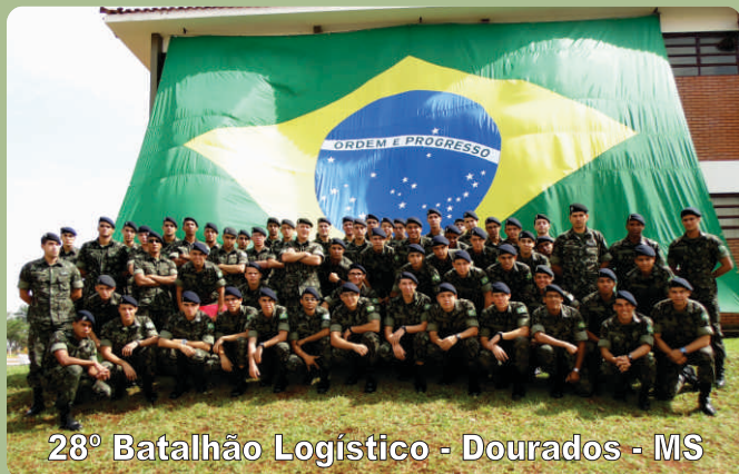
28º Batalhão Logístico - Dourados - MS

Grosso do Sul, onde tiveram a oportunidade de acompanhar as atividades realizadas pelos integrantes do Exército Brasileiro na manutenção da soberania da fronteira oeste.