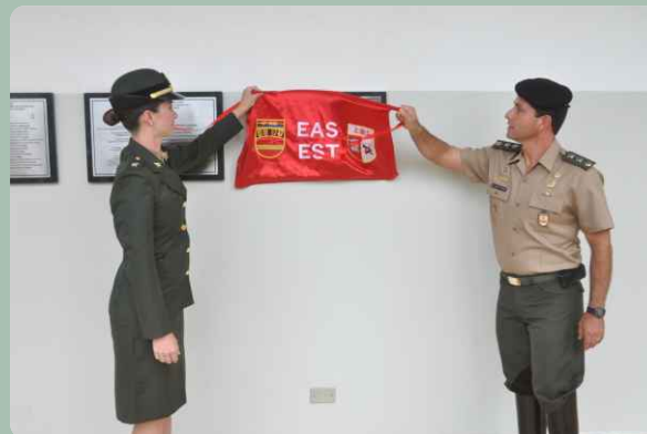
Inauguração da placa da turma

Os familiares dos estagiários compareceram em grande número para acompanhar as atividades.