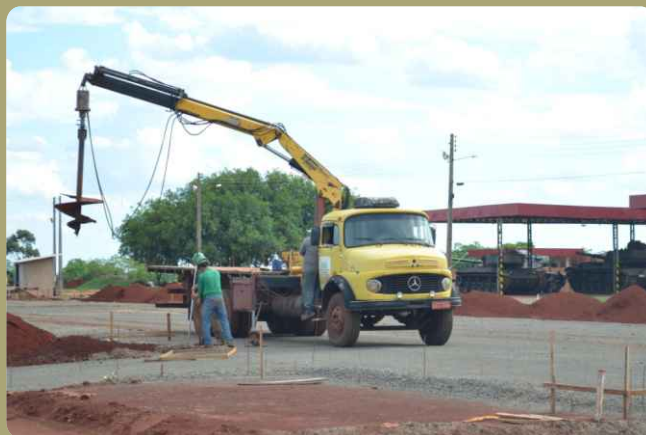
Obras do pavilhão de manutenção

Diversas obras de engenharia estão sendo realizadas no interior do 20º RCB visando adequar as instalações para serem utilizadas pelas Viaturas Blindadas de Combate CC M60A3 TTS.