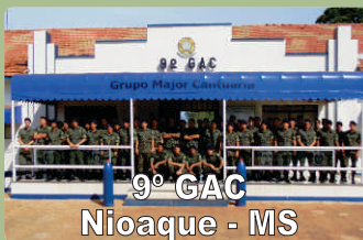
9º GAC Nioaque - MS