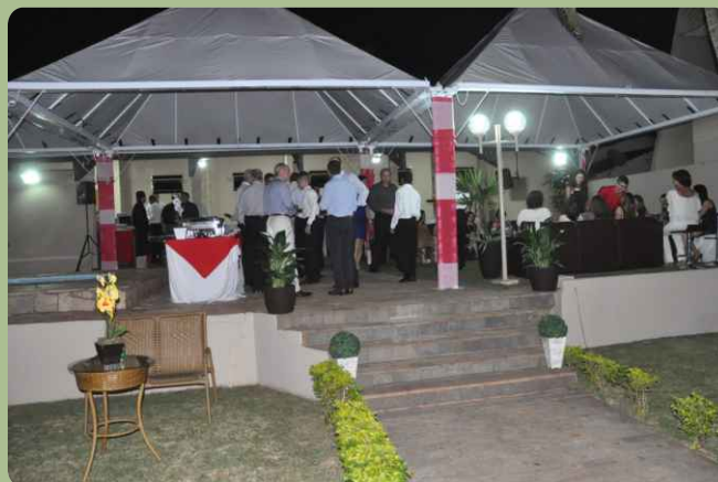
Visão parcial do local do evento