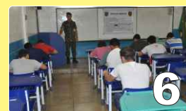
Concurso para Sargento