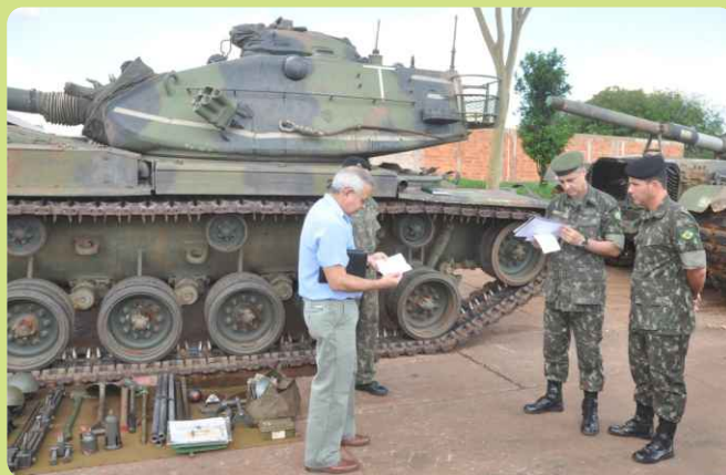
9º Grupamento Logístico realiza inspeção no 20º RCB

Na ocasião, foi realizada uma inspeção logística em que foi verificada a correta escrituração da documentação e a manutenção de viaturas, materiais e equipamentos.