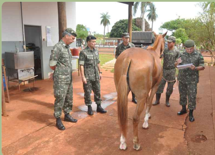
Centro hípcico do 20º RCB é inspecionado

Uma comitiva da Seção de Remonta e Veterinária, órgão da Diretoria de Abastecimento, esteve nas instalações hípcas do 20º RCB no dia 10 de outubro, onde realizou uma inspeção sanitária de rotina nos equinos do “Regimento Cidade de Campo Grande”.