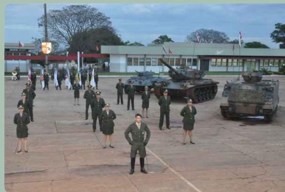
Visão parcial do pátio de formaturas