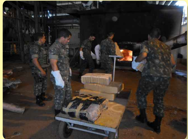
Queima dos entorpecentes