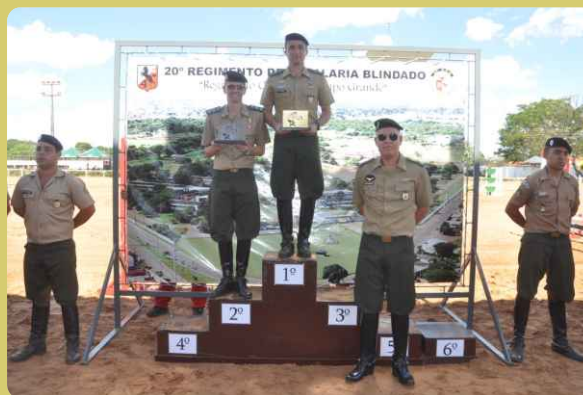
Exmo. Sr. General Carvalho realiza a entrega da premiação ao 20º RCB, campeão geral por equipes