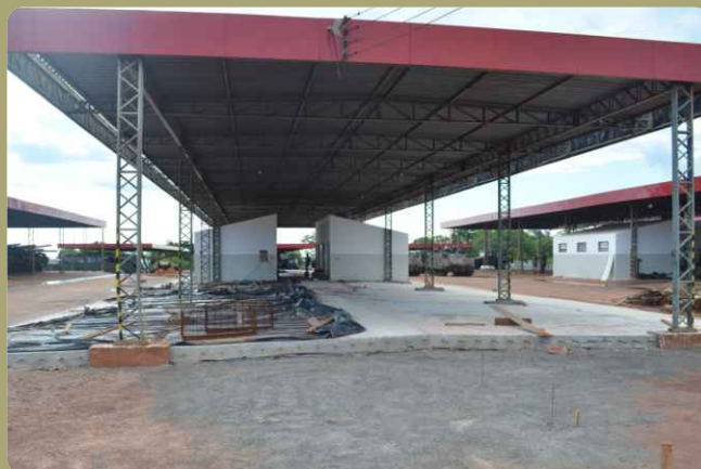
Troca e ampliação do piso das garagens