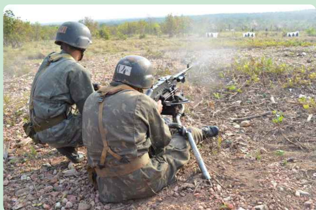
Tiro de metralhadora MAG