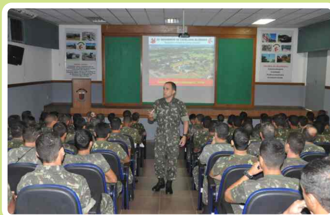
Comandante do 20º RCB ministra palestra

Na ocasião, foi feita uma avaliação das atividades desenvolvidas no ano passado e foram explanadas as Diretrizes de Comando para o ano de 2014.