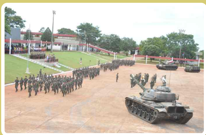
Visão geral do local da solenidade

Posteriormente, o Ten Cel Vinícius , Comandante do 20º RCB, realizou a entrega de Diplomas de "Amigo do Regimento" aos civis e militares que contribuíram significativamente com as atividades desenvolvidas pelo "Regimento Cidade de Campo Grande".