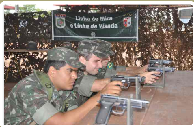
Instrução Preparatória para o Tiro