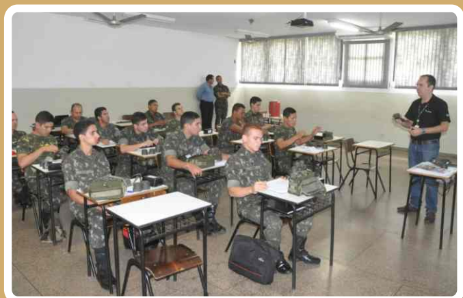
20º RCB sedia estágio de uso de binóculo