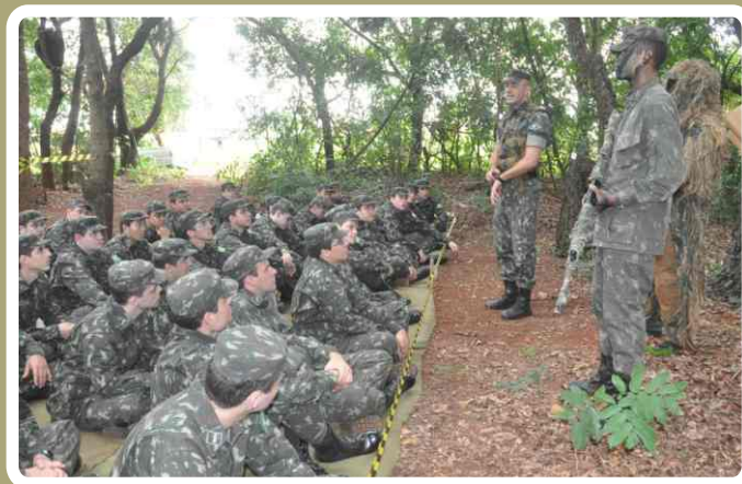
Instrução de camuflagem