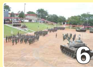
Aniversário do Regimento