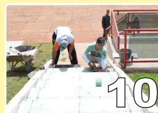
Melhoria das instalações