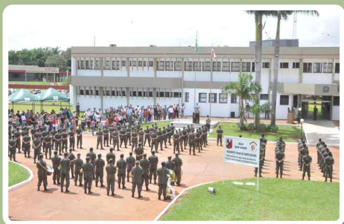
Visão geral do local da solenidade