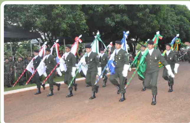
20º RCB participa das comemorações dos 69 anos da Tomada de Monte Castelo