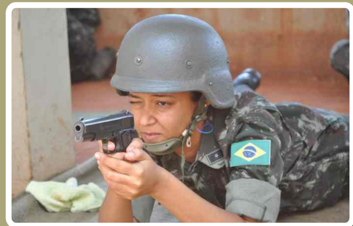
Realização do tiro real de pistola