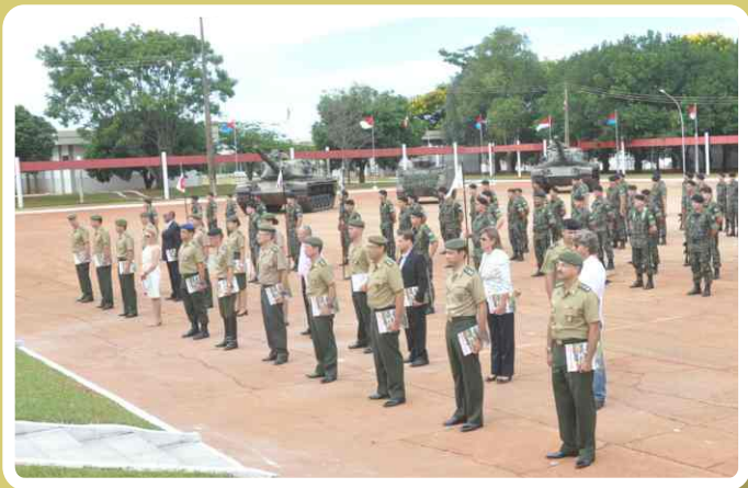
Entrega de Diplomas de Amigo do 20º RCB