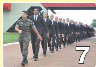
Incorporação do NPOR