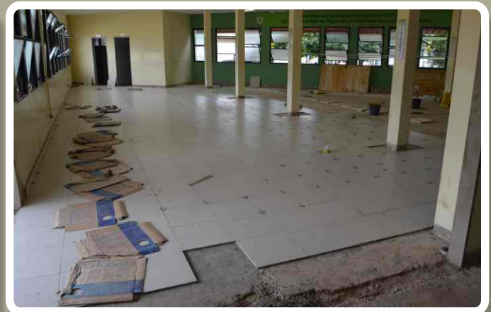
Troca do piso do refeitório dos alunos e dos cabos e soldados