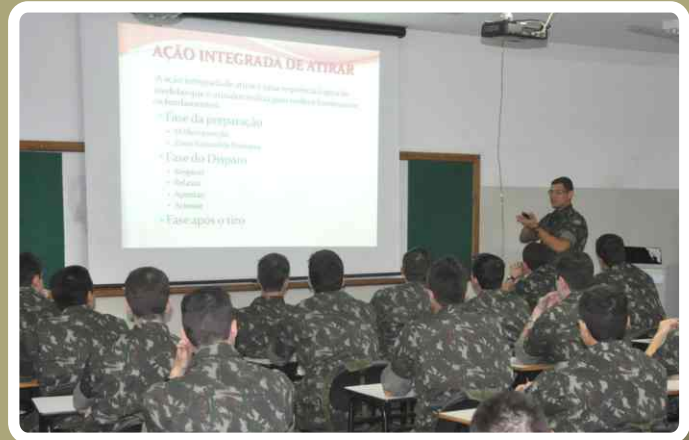
Instrução de armamento, munição e tiro

A formatura da "Turma Sesquicentenário da Epopeia de Antonio João" será realizada no dia 17 de março. Posteriormente, os estagiários serão designados para ocuparem cargos técnicos em diversas Organizações Militares do Comando Militar do Oeste.