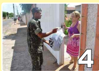
Campanha do agasalho