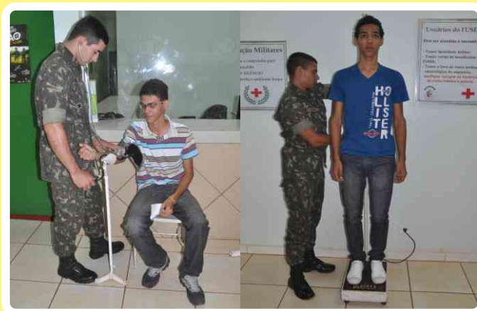
Inspeção de saúde e exame biométrico