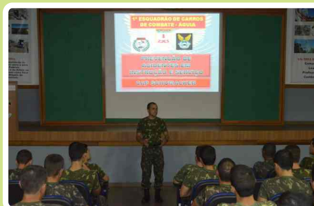
Instrução sobre prevenção de acidentes