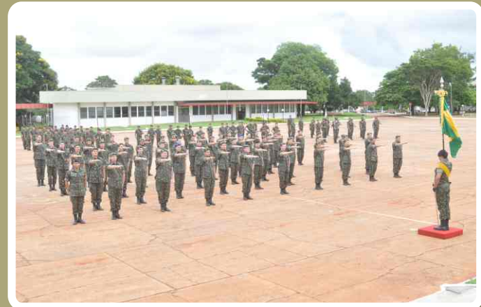
Compromisso à Bandeira Nacional