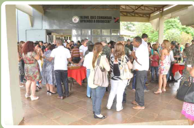
Coquetel com os familiares dos alunos