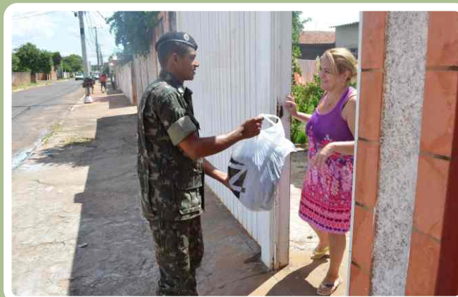
Recolhimento das doações

As doações recebidas foram encaminhadas para a Capelania Militar, que realizará a distribuição dos materiais para a população carente de Campo Grande