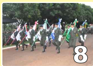
Tomada de Monte Castelo