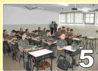
Estágio de binóculo