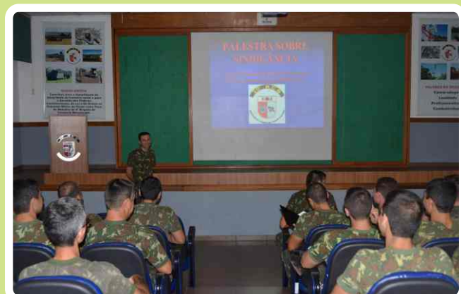
Instrução sobre sindicâncias

No dia 06 do mesmo mês, o assunto versou sobre a prevenção de acidentes em instrução e serviço.