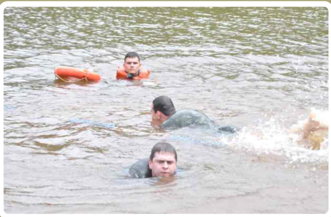
Transposição de curso de água