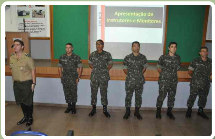
Apresentação de instrutores e monitores