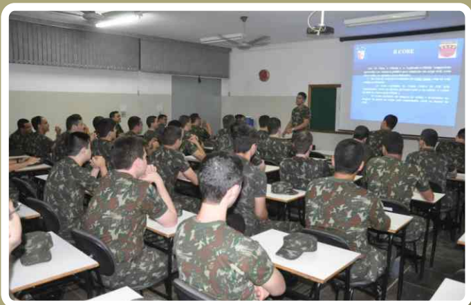
Instruções sobre regulamentos militares