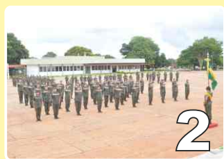
Início do EAS-EST