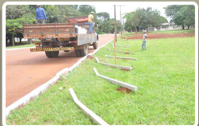
Instalação de novas cercas no perímetro da Unidade