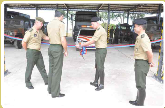
Inauguração da garagem do SISFRON

No dia 13 de fevereiro, foi realizada uma solenidade comemorativa aos 28 anos de criação do 20º Regimento de Cavalaria Blindado.