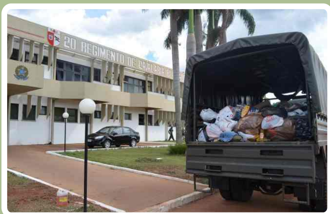
Triagem dos materiais arrecadados