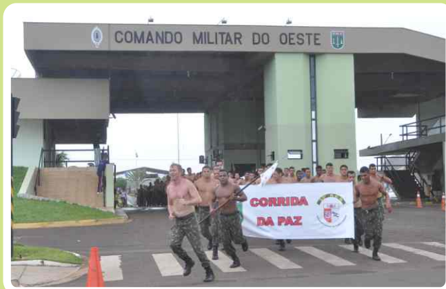
Militares do 20º RCB participam da Corrida da Paz