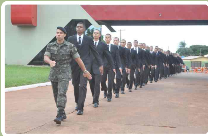
Entrada simbólica pelo portão das armas

Ao término do evento, os familiares dos discentes visitaram as instalações do NPOR, onde foi servido um coquetel comemorativo.