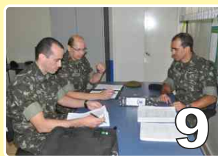
Inspeção da 9ª ICEx