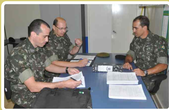
9ª ICFEx realiza Visita de Orientação Técnica ao 20º RCB