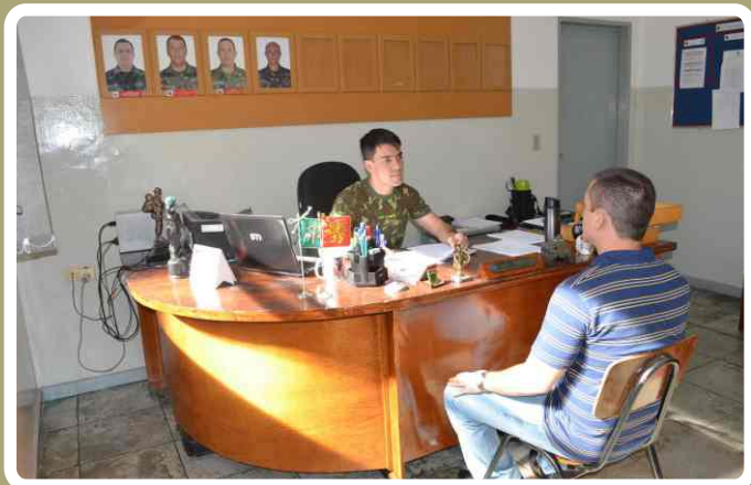
Entrevista com os estagiários

No mês de fevereiro, mais uma turma formada por sessenta Aspirantes-a-Oficial incorporou no 20º RCB para realizar o Estágio de Adaptação e Serviço (EAS) e o Estágio de Serviço Técnico (EST).