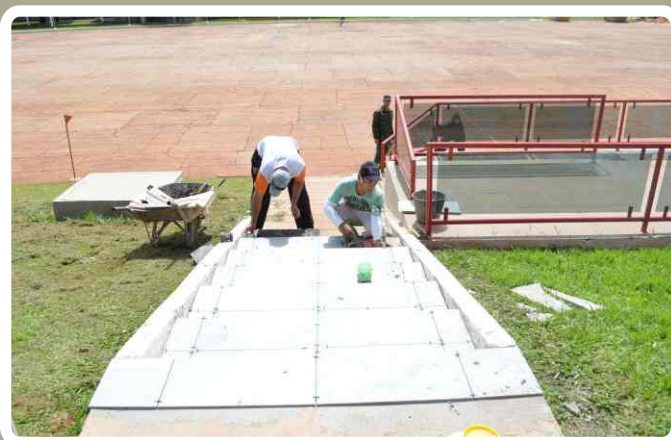
Colocação de piso na escada de acesso ao palanque