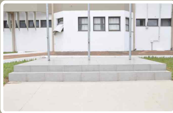
Adequação e reforma dos mastros