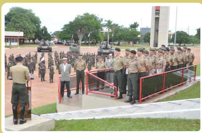
Palavras do Comandante da Unidade