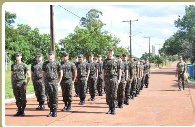
Instrução de ordem unida