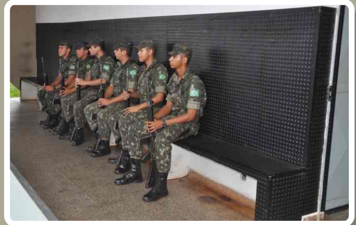
Adequação do corpo da guarda

Os trabalhos estão sendo realizados com o objetivo de proporcionar maior funcionalidade às instalações, para que os "Lanceiros de Campo Grande" tenham melhores condições de conforto e segurança para cumprirem as diversas missões que a Unidade recebe.