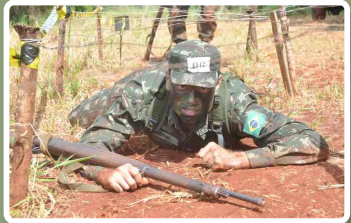
Instrução de progressão diurna

Após o término do estágio, os integrantes da “Turma Sesquicentenário da Epopeia de Antonio João” serão designados para ocuparem cargos técnicos nas diversas Organizações Militares do Comando Militar do Oeste.