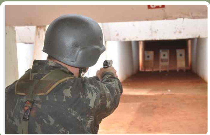
Competição de tiro de pistola