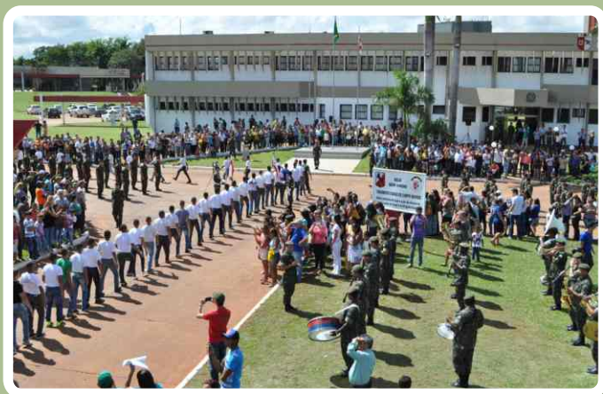
Recepção pelos familiares

O evento foi encerrado com uma formatura, onde os novos militares trajaram pela primeira vez o uniforme camuflado.