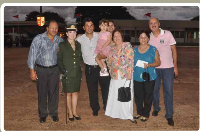
Familiares dos estagiários prestigiam o evento