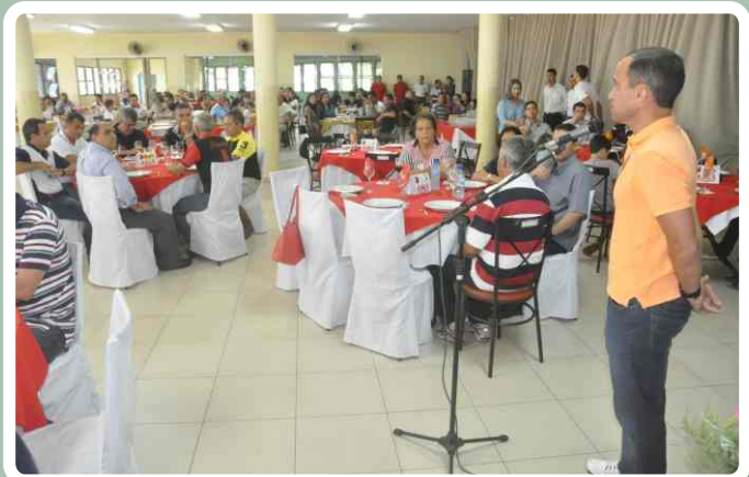
Palavras do Comandante do 20º RCB