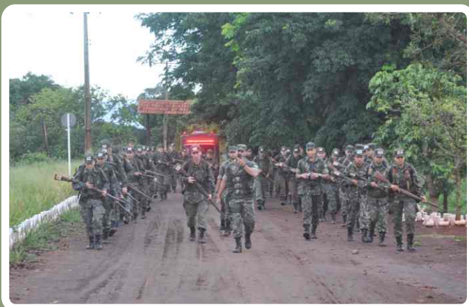
Marcha a pé

Posteriormente, foram ministradas instruções de higiene, profilaxia e primeiros socorros, maneabilidade, pista de cordas, camuflagem, orientação, dentre outras.