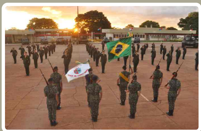
Visão geral do pátio de formaturas

As atividades foram encerradas com um coquetel, que contou com a presença dos familiares dos formandos.