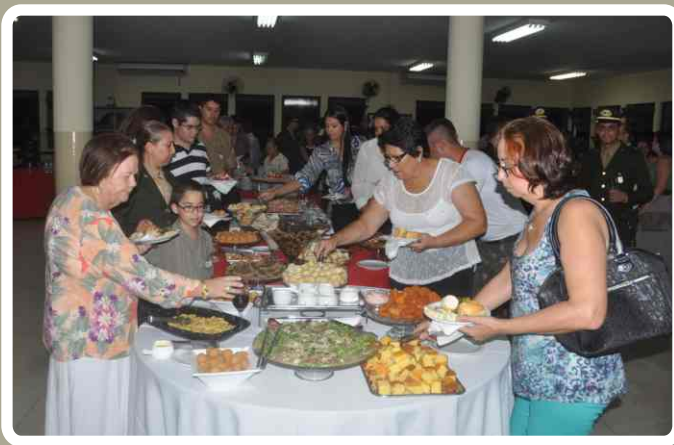
Coquetel de confraternização