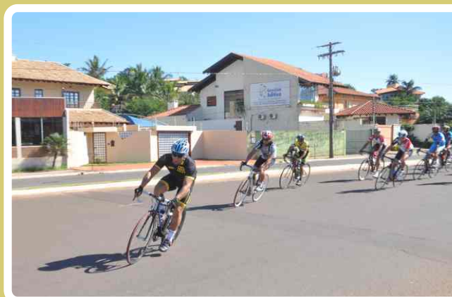
Atleta do 20 RCB participa de competição nacional de ciclismo