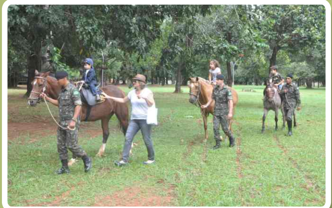
Passeio a cavalo