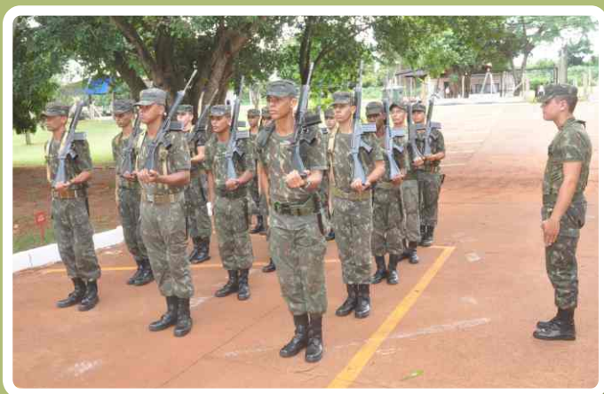
Instrução de ordem unida

Os duzentos e oitenta e nove instruídos foram divididos em pequenas frações, para facilitar e potencializar o aprendizado, dando a oportunidade aos instrutores de fazerem um acompanhamento individualizado do desempenho de cada um.