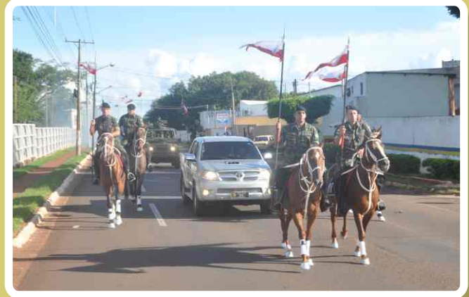
Escolta de honra hipomóvel e motorizada