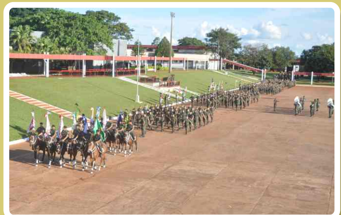
Desfile em continência ao Comandante da 4ª Bda C Mec