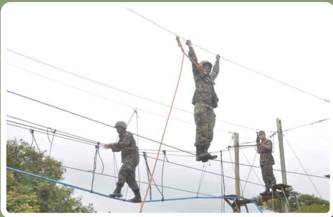
Pista de cordas