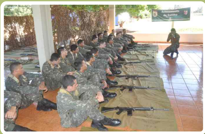
Instrução Preparatória para o Tiro