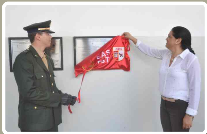
Inauguração da placa da turma

No dia 17 de março, foi realizada a solenidade de formatura do Estágio de Adaptação e Serviço (EAS) e do Estágio de Serviço Técnico (EST), que foi conduzido pelo 20º Regimento de Cavalaria Blindado, sob a coordenação da 9ª Região Militar.