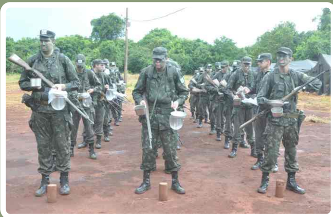
Formatura para o almoço