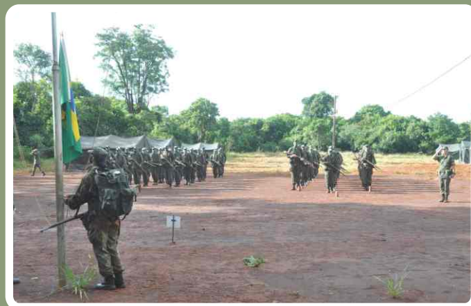
Hasteamento do Pavilhão Nacional