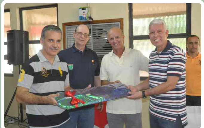
Homenagem ao Comandante da 4ª Bda C Mec