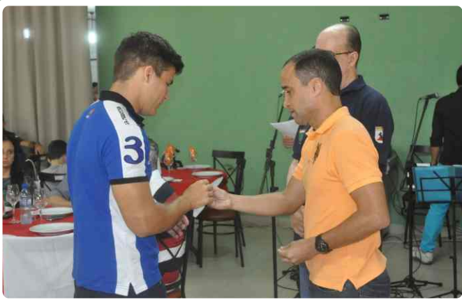
Recepção dos novos confrades