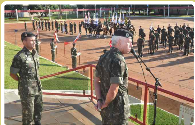
Exmo. Sr. Gen Carvalho despede-se do 20º RCB