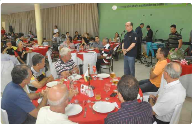
Palavras do Presidente de Honra da 3C