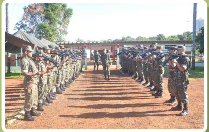
Instrução de armamento, munição e tiro

Após o término do ano de instrução, os jovens serão licenciados do serviço ativo e passarão a integrar a reserva mobilizável do Exército Brasileiro, estando aptos para, se preciso for, serem novamente convocados para atuarem nas situações previstas em lei.