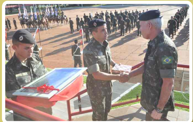
Entrega de lembrança