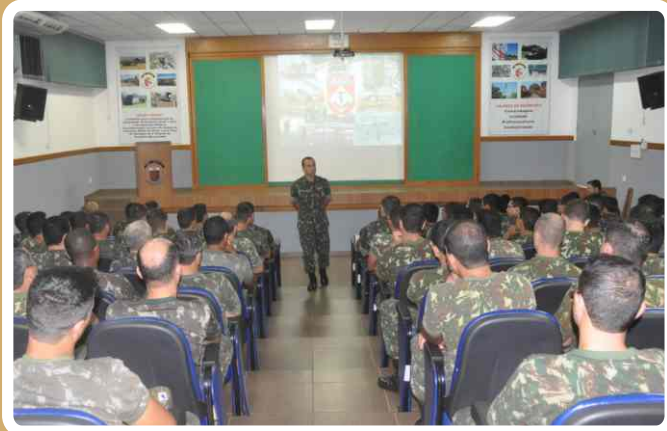
20º RCB promove simpósio de administração