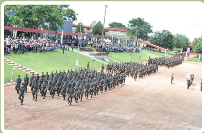
Desfile em continência ao Comandante do 20º RCB