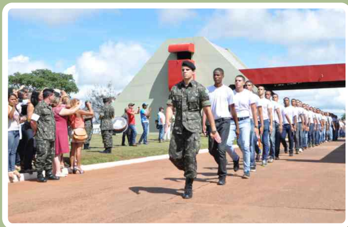
Entrada solene pelo portão das armas

No dia 06 de março, foi realizada a solenidade de incorporação dos novos soldados do 20º Regimento de Cavalaria Blindado.