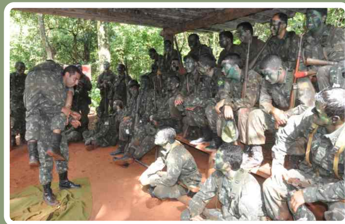
Instrução de primeiros socorros