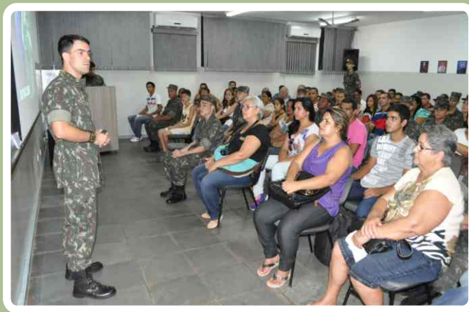
Reunião com os pais dos novos soldados