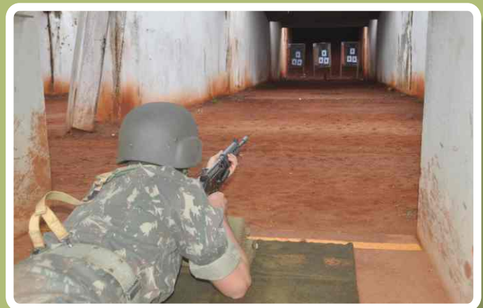
Realização do tiro real de fuzil