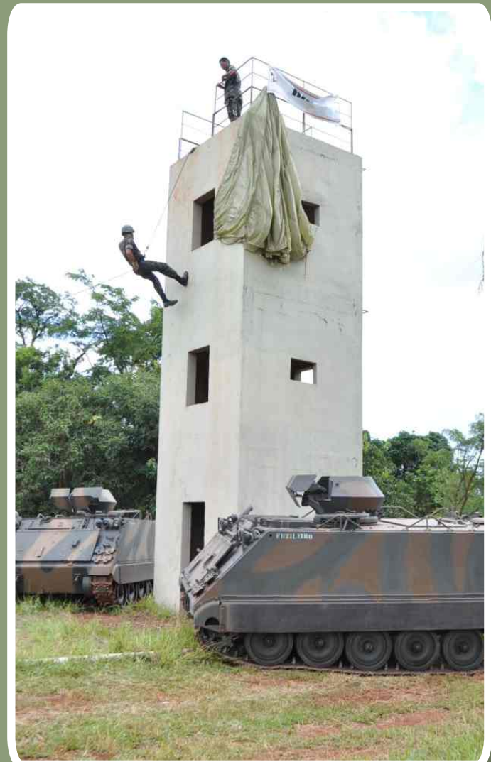
Instrução de rapel