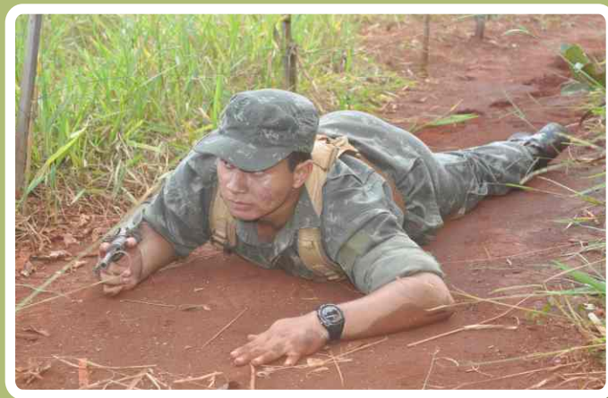
Prática de manobrabilidade