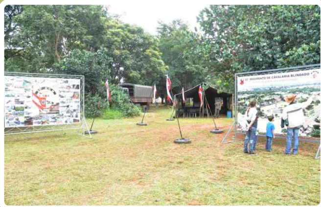
Exposição de material

O evento foi promovido pela ONG “Mães da Fronteira” e contou com a participação dos órgãos de segurança pública e entidades civis.