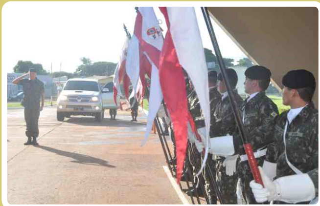
Recepção pela guarda guaicurus