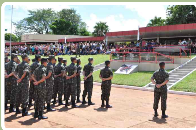
Primeira formatura trajando o uniforme camuflado