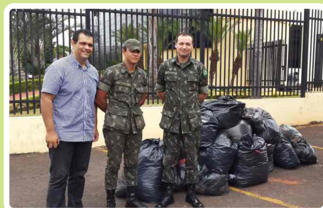
Capelania Militar realiza entrega de doações