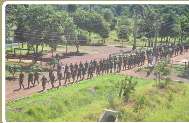
Integrantes do 20º RCB participam de marcha a pé de 8 km