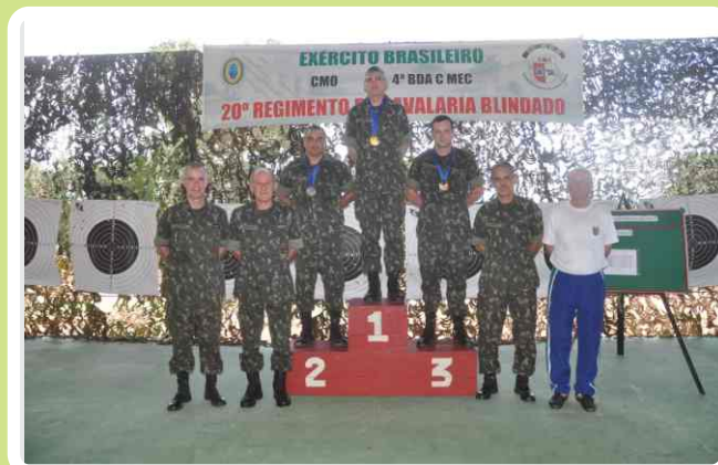
20º RCB organiza competição de tiro em Betione