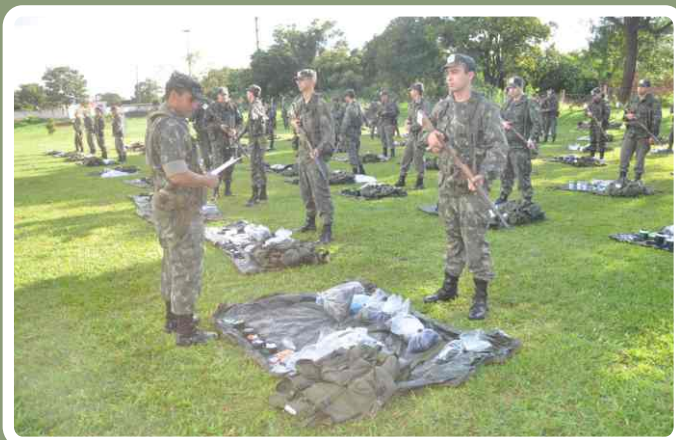
Verificação do apronto operacional

No período de 10 a 12 de março, os sessenta Aspirantes-a-Oficial que estão realizando o Estágio de Adaptação e Serviço (EAS) e o Estágio de Serviço Técnico (EST) no 20º RCB participaram de instruções no campo.