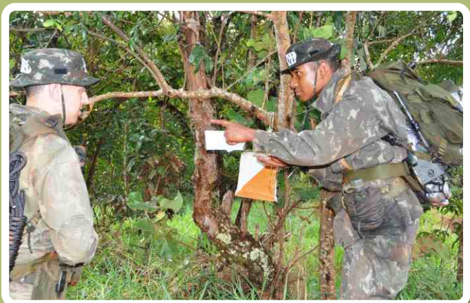
Pista de orientação