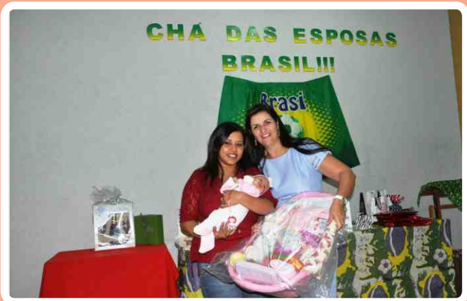
Entrega de kit do Projeto Costurinha