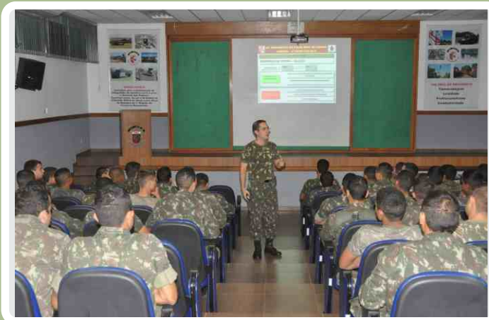
Força Pantanal do 20º RCB participa de instrução

No dia 02 de junho, os integrantes da Força Pantanal (FORPAN) participaram de uma instrução visando manter o constante adestramento da tropa de pronto-emprego do 20º Regimento de Cavalaria Blindado.