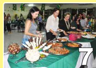
Chá das esposas