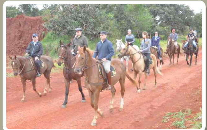
20º RCB promove cavalgada no interior do Regimento