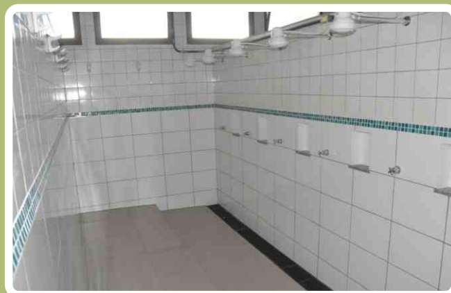
Banheiro dos alunos do Curso de Formação de Sargentos (CFS) do 20º RCB é totalmente reformado