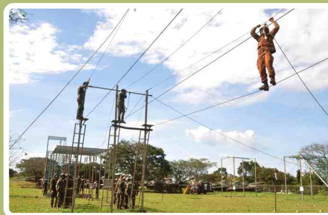
Pista de cordas