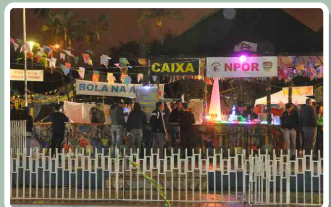
20º RCB participa do "Arraiá do Zé Cuturno"