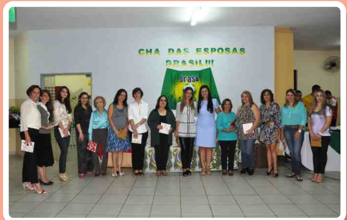
Homenagem às aniversariantes