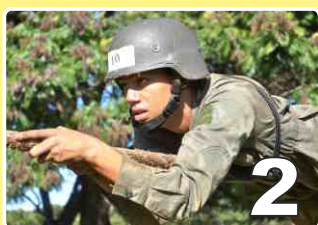
Campo do NPOR

(Projeto Costurinha, Chá das Esposas e Festa Junina), além de diversos outros eventos que evidenciaram a grande dedicação e o elevado valor profissional dos integrantes do "Regimento Cidade de Campo Grande".