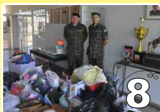
Campanha do Agasalho