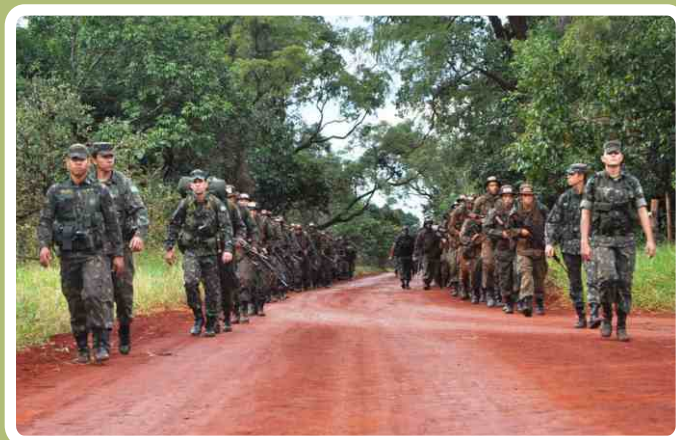
Marcha a pé