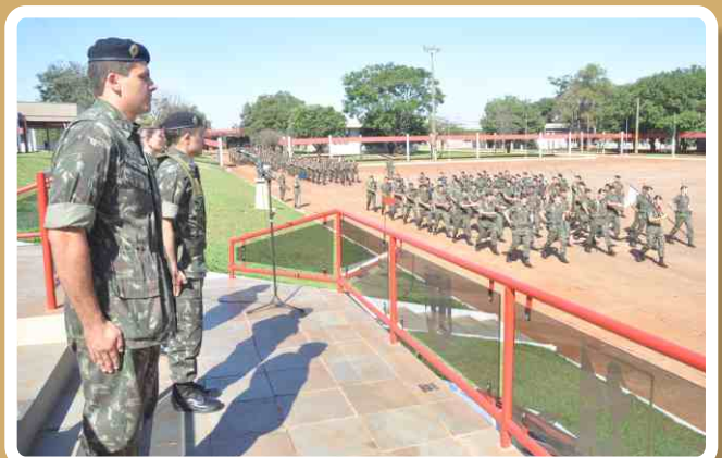
20º RCB homenageia militares do Serviço de Veterinária