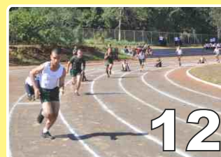
Olimpíadas do CFS