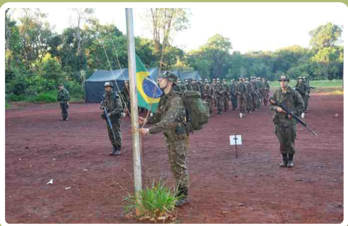
Hasteamento do Pavilhão Nacional