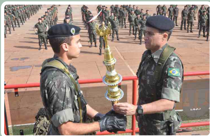
Esquadrão de Comando e Apoio do 20º RCB recebe Troféu Osorio