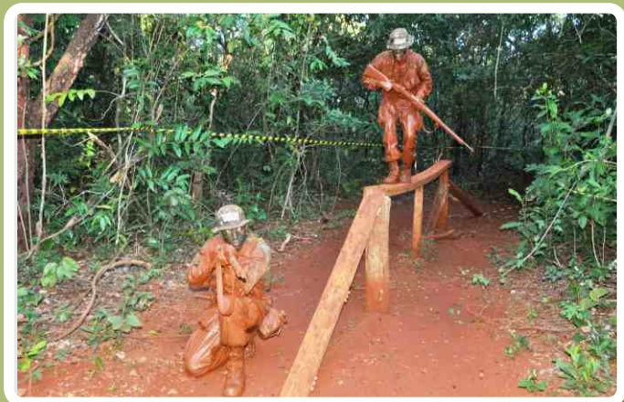
Pista de progressão diurna