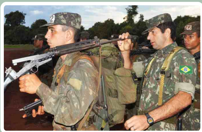
Inspeção do armamento

Na ocasião, os alunos tiveram a oportunidade de participar de diversas instruções teóricas e práticas que visaram preparar os futuros aspirantes-a-oficial da reserva para ocuparem a função de Comandantes de Pelotão.