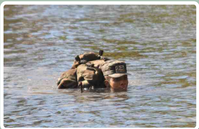
Transposição de curso de água