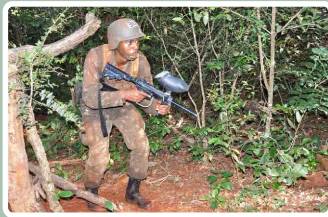
Pista de progressão diurna