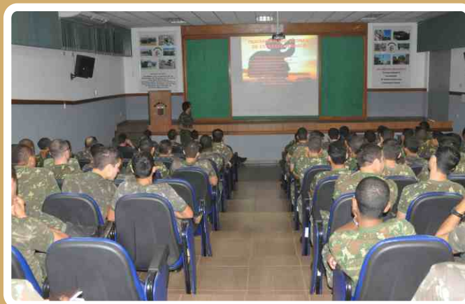
20º RCB realiza instrução sobre rabdomiólise

No dia 27 de junho, os "Lanceiros de Campo Grande" participaram de uma palestra sobre rabdomiólise, que foi ministrada pelo médico da Unidade.