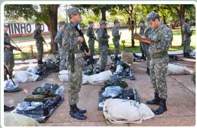
Verificação do apronto operacional

No período de 02 a 06 de junho, os alunos do Núcleo de Preparação de Oficiais da Reserva (NPOR) do 20º RCB participaram de um Exercício de Longa Duração (ELD) na área de acampamento do Regimento.