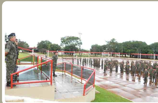
Militares promovidos são homenageados no 20º RCB