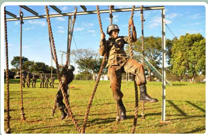
Pista de cordas