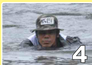
Campo do CFS