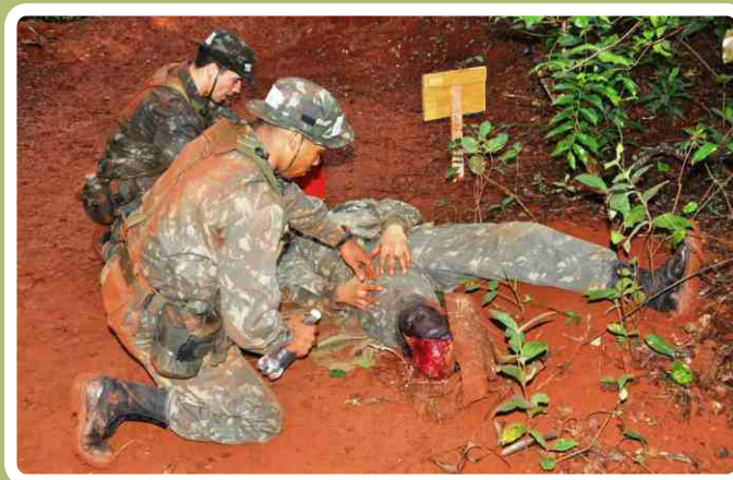
Instrução de primeiros socorros