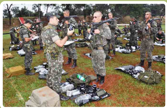
Verificação do Apronto Operacional

Todas as instruções ministradas foram voltadas para a prática dos instruídos e fizeram parte das atividades previstas para o período básico de formação dos futuros sargentos do Exército Brasileiro.