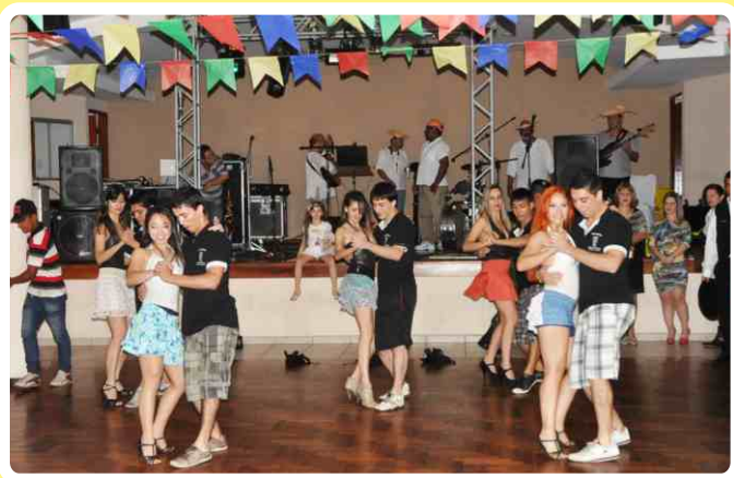
Apresentação de dança