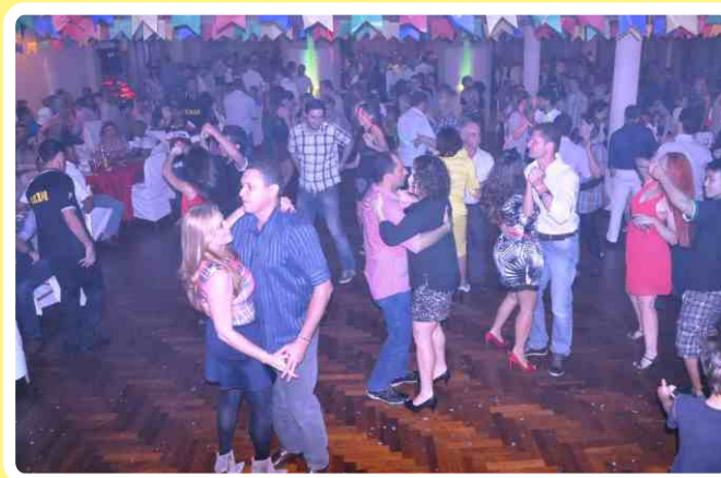
Pista de dança