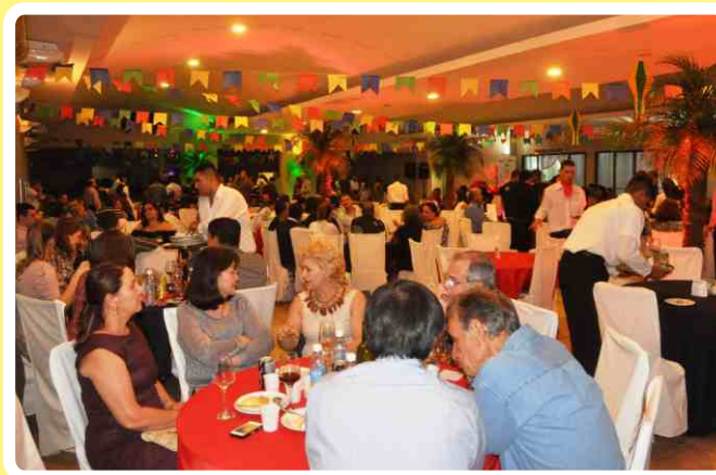
Visão parcial do salão