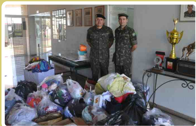
20º RCB realiza entrega de doações para a Capelania Militar