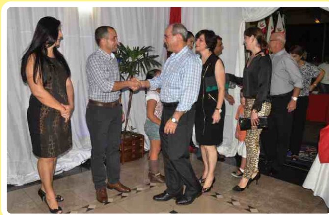
Recepção dos convidados

Essa é uma iniciativa solidária das esposas dos militares de Campo Grande, que a mais de 30 anos confeccionam e distribuem enxovais para os filhos dos cabos e soldados do Comando Militar do Oeste.