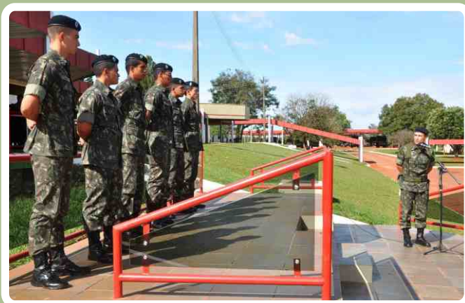
Aspirantes-a-oficial concluem Estágio de Instrução Para Oficiais Temporários (EIPOP)