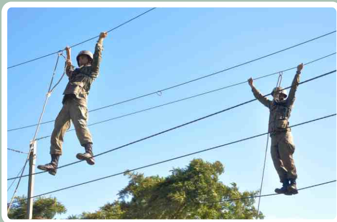
Pista de cordas