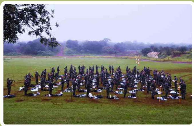
Verificação do apronto operacional

No período de 09 a 14 de junho, os alunos do Curso de Formação de Sargentos (CFS) do 20º RCB participaram de um Exercício de Longa Duração na área de acampamento do "Regimento Cidade de Campo Grande".