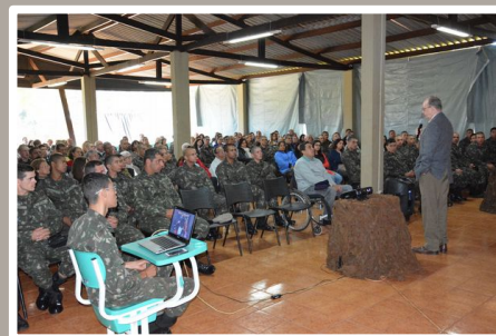
Palavras do Gen Lima