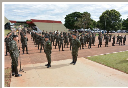
Boas-vindas do Comandante