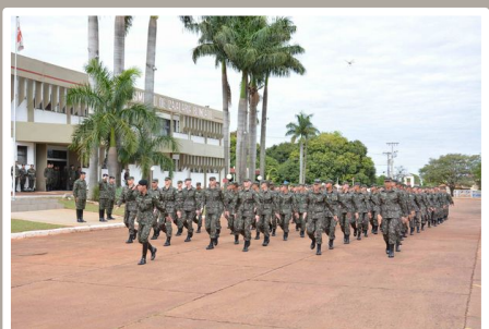
Primeira solenidade fardado