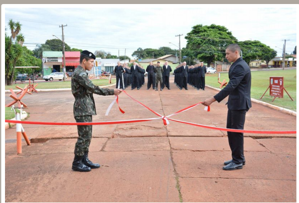
Abertura simbólica do Portão das Armas