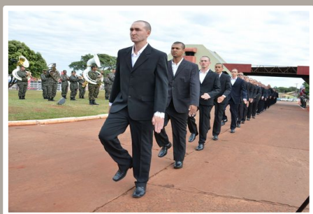
Entrada dos novos alunos