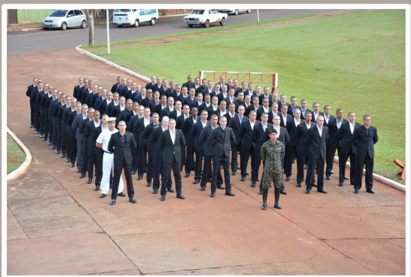
Visão geral dos novos alunos do CFS

No dia 29 de abril, foi realizada a solenidade de incorporação dos novos alunos do Curso de Formação de Sargentos (CFS) do 20º RCB.