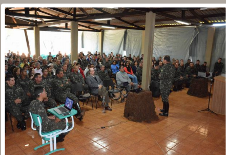
Palavras do Comandante