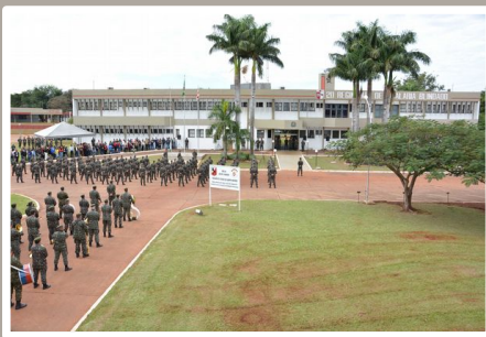
Visão geral do local do evento