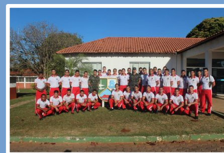
4ª Cia E Cmb Mec - Jardim