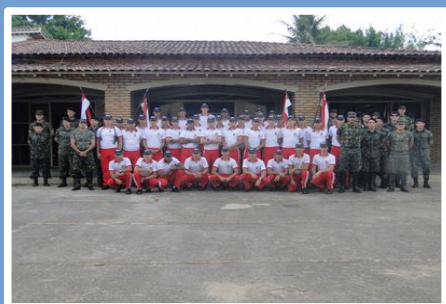
10º R C Mec - Bela Vista