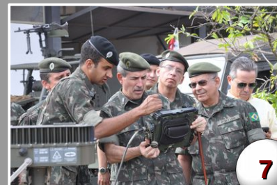
Olimpíadas da 4ª Bda C Mec