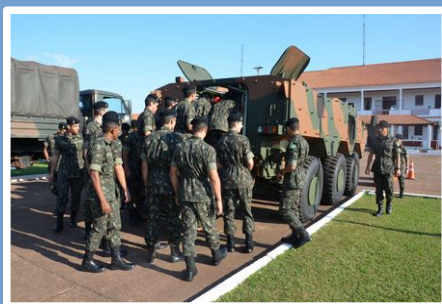
11º R C Mec – Ponta Porã