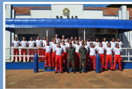
9º GAC - Nioaque

Na ocasião, os futuros oficiais de cavalaria da reserva tiveram a oportunidade de acompanhar as atividades desenvolvidas pelas seguintes Unidades que atuam na defesa da fronteira oeste: 9º Grupo de Artilharia de Campanha (Nioaque), 4ª Companhia de Engenharia de Combate Mecanizada (Jardim), 10º Regimento de Cavalaria Mecanizado (Bela Vista), 11º Regimento de Cavalaria Mecanizado (Ponta Porã) e 17º Regimento de Cavalaria Mecanizado (Amambaí).