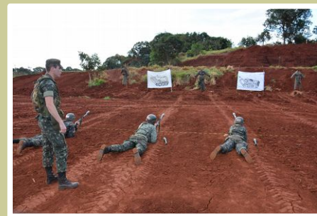
Alunos do CFS do 20º RCB participam de instruções no campo