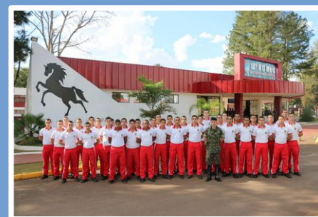
17º R C Mec – Amambaí