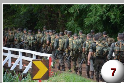
Marcha de 24 km