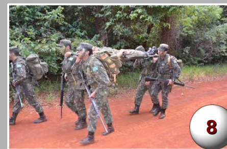
Exercício de Liderança