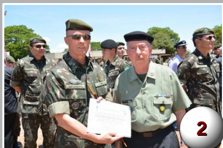
Dia do oficial temporário