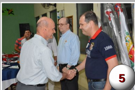
Reunião da 3C