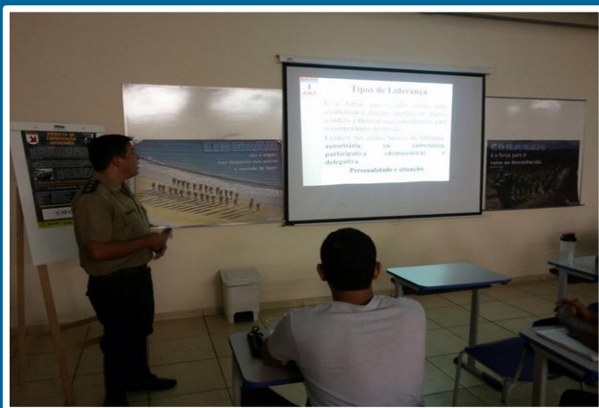
Palestra para acadêmicos