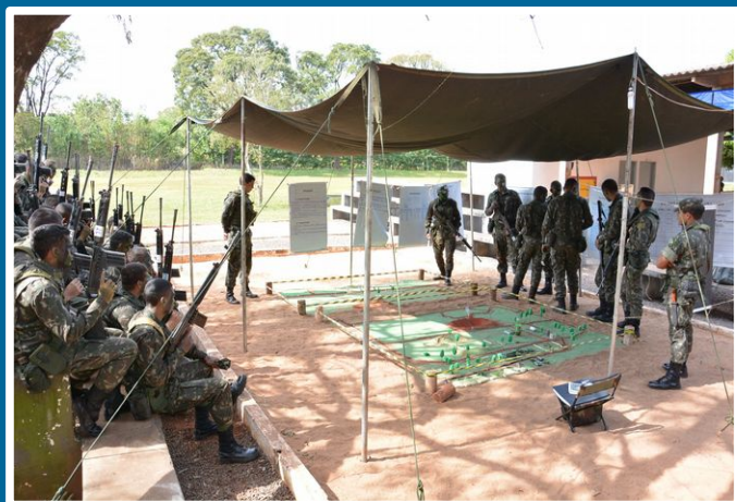
Instrução de patrulhas -CLPF